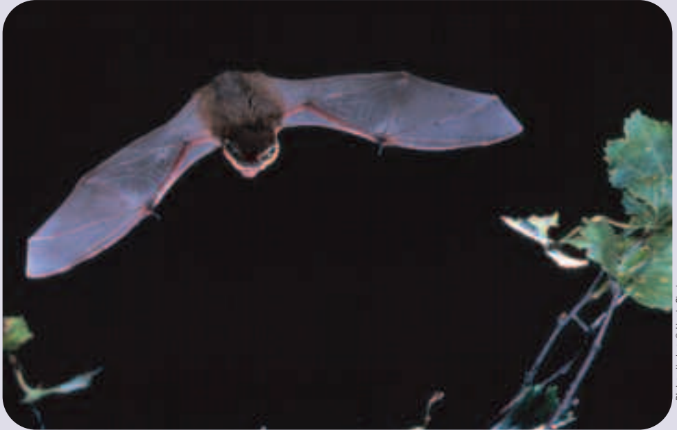
Pipistrelle bat

Mae llawer ohonom wedi treulio nosweithiau hir yn yr haf yn eistedd yn ein gerddi, yn gwylio wrth i ystlumod gymryd lle'r gwenoliaid yn awyr y cyfnos. Mae'r creaduriaid bach a rhyfeddol hyn yn aml yn byw yn agos at bobl, gan ddefnyddio gerddi fel ffynhonnell bwysig ar gyfer bwyd, dŵr a chysgod.